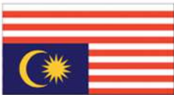
Bendera TIDAK BOLEH digantung secara terbalik