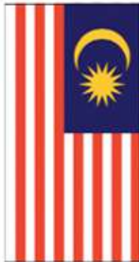
Bendera saiz biasa TIDAK BOLEH digantung secara menegak