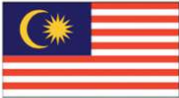
Bendera saiz biasa

Jalur Gemilang hendaklah dipasang secara melintang sahaja.